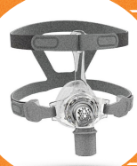
MÁSCARA NASAL VENTILADA

Conectada ao paciente por meio de interfaces oronasais e nasais.