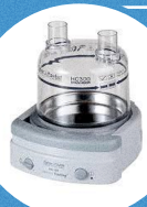
BASE AQUECIDA COM CÂMARA DE ÁGUA