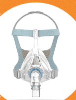
MÁSCARA ORONASAL VENTILADA