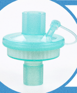
FILTRO HME Substitui a base aquecida com câmara de água